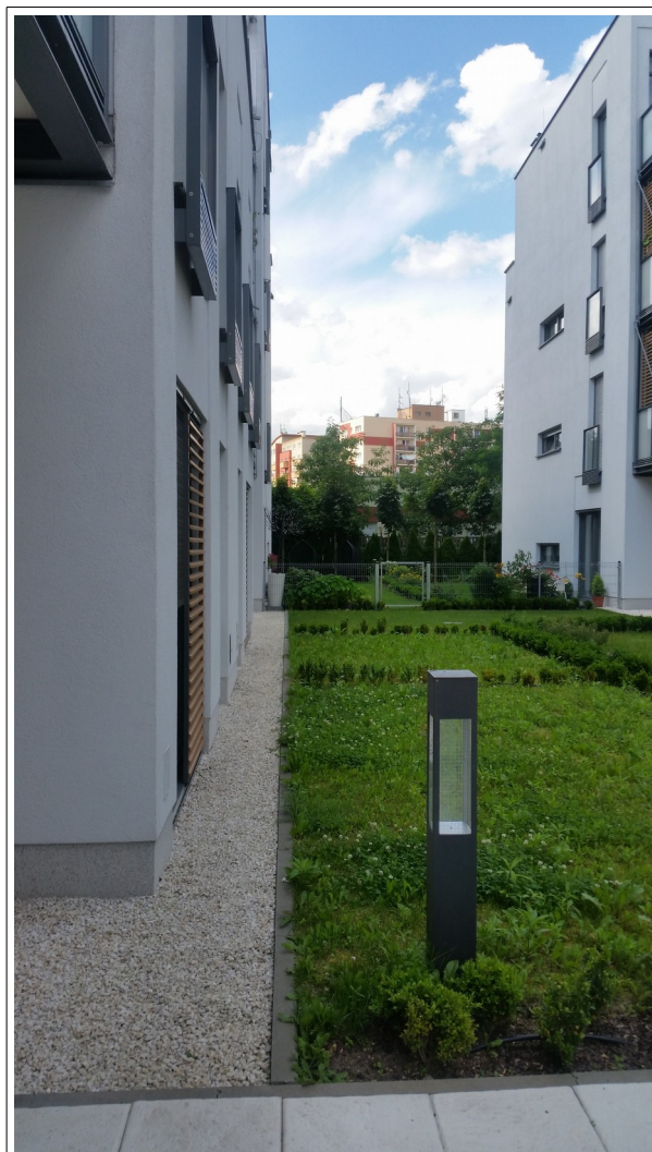
Fot. 2 Widok teren od Smardzewskiej 17