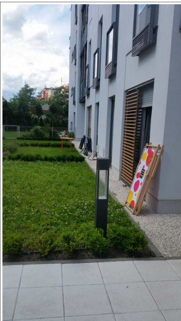
Fot. 3 Widok teren od Smardzewskiej 19