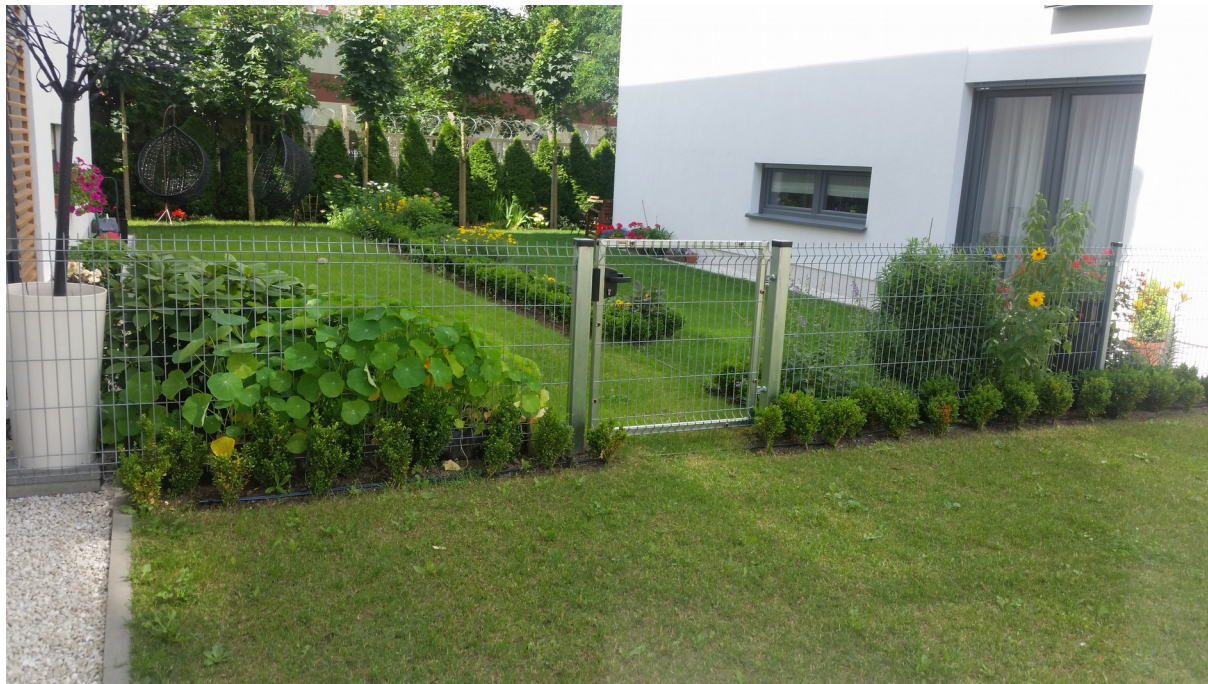
Fot. 4 Wzór odgradzenia (bez furtki)