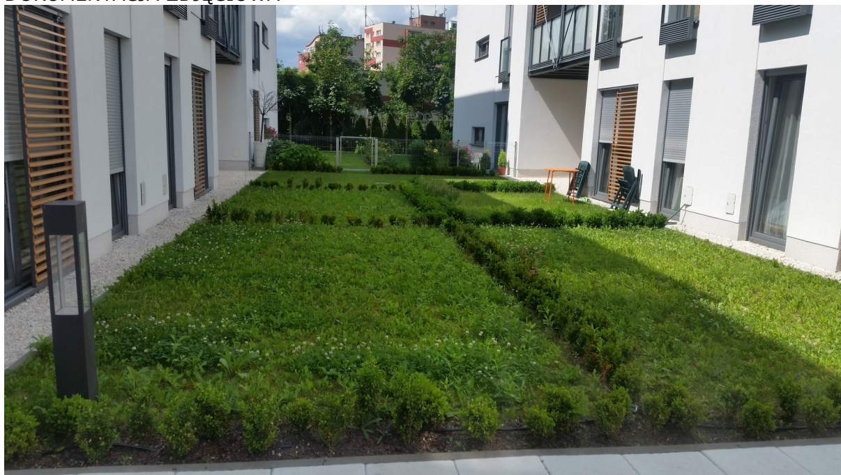
Fot. 1 Widok terenu do ogrodzenia